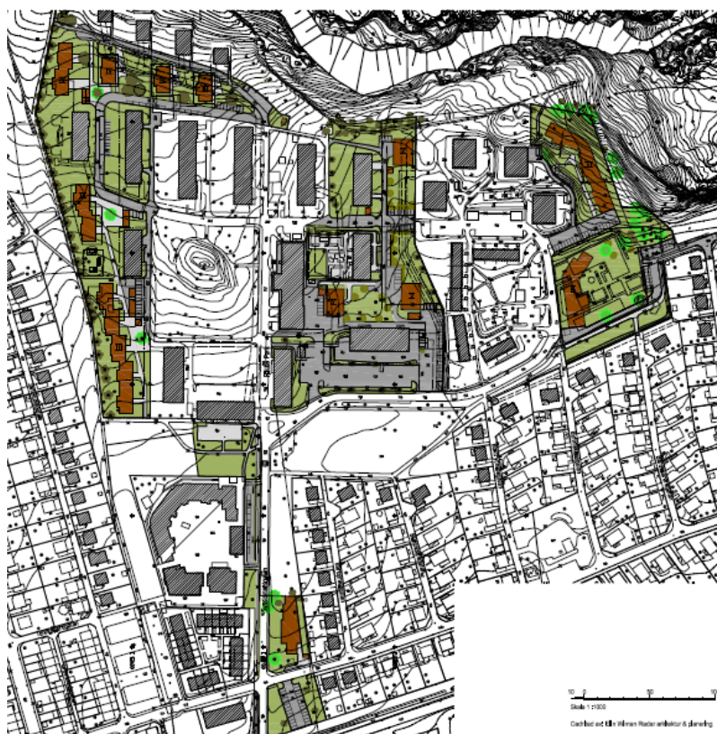
Illustrationsritning med föreslagen ny bebyggelse markerad i brunt.